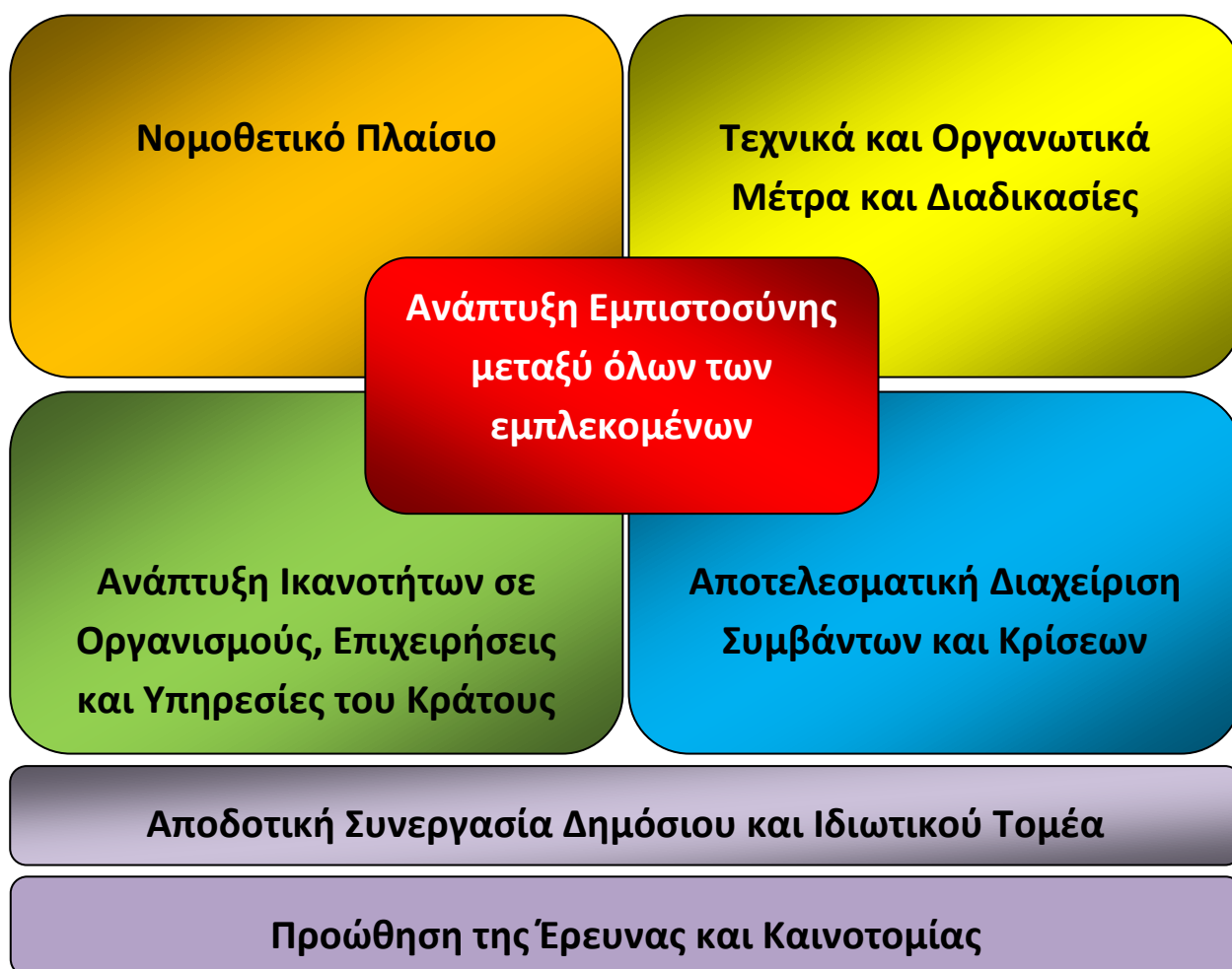
Γράφημα 1: Τομείς Προτεραιότητας της Στρατηγικής Κυβερνοασφάλειας της Κυπριακής Δημοκρατίας