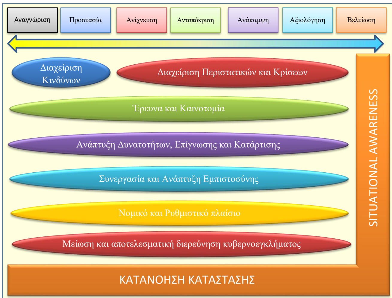
Γράφημα 2: Θεματικές Ενότητες Στρατηγικής σε σχέση με τον κύκλο ενεργειών για την αντιμετώπιση περιστατικών κυβερνοασφάλειας

Για την καλύτερη κατανόηση των δραστηριοτήτων που καθορίζει η Στρατηγική, το γράφημα 2 παρουσιάζει πως οι στρατηγικοί στόχοι, είναι δυνατόν να συμβάλουν στις κοινά αποδεκτές/εφαρμοστέες ενέργειες 7 για την αντιμετώπιση απειλών και περιστατικών κυβερνοασφάλειας.